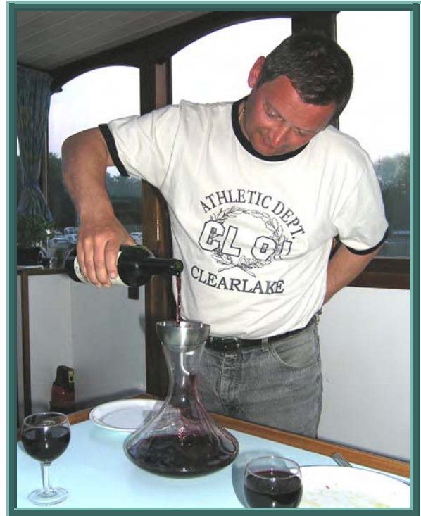
Der „Deklinator“ 1

finden. Ohne Pastis ist für unsere Mannschaft eine Bootstour kaum vorstellbar. Zwischen den Gängen kann auch mal ein „Iteratif“ durchaus angebracht sein. Zum Abschluss gehört auf jeden Fall noch ein Digestif. Auch hier sind wir zumeist sehr der französischen Lebensart verbunden mit einem L'eau de vie oder auch Calvados. Dieses Jahr hatte allerdings ein Kräuter aus dem hohen Norden den Vorrang, ein „Flensburger Dokator“. Zum Nachmittag ist bisweilen ein Aperol on the rocks in Verbindung mit einem Espresso angezeigt.