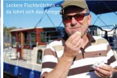
Leckere Fischbrötchen – da lohnt sich das Angelen!

Wer vom 22.9. bis 7.10.2012 ein Hausboot von KUHLE-TOURS für mindestens drei Nächte bucht, erhält von uns drei Gutscheine für Übernachtungen an den Anlegestellen der Müritzfischer (vorbehaltlich freier Liegeplätze): Fischerhof Vipperow, Röbel, Eldenburg und Malchow sowie Erlebnisräucherei Damerower Werder. Geben Sie bei der Buchung bitte das Stichwort „Fischtage“ an.