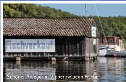
Schöner Anleger in Vipperow beim Fischer