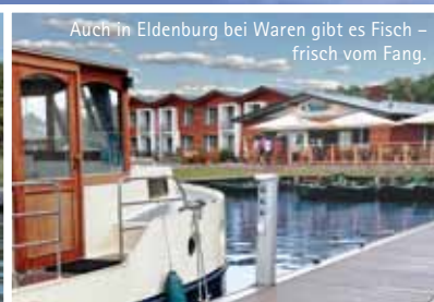
Auch in Eldenburg bei Waren gibt es Fisch – frisch vom Fang.

Wer vom 22.9. bis 7.10.2012 ein Hausboot von KUHLE-TOURS für mindestens drei Nächte bucht, erhält von uns drei Gutscheine für Übernachtungen an den Anlegestellen der Müritzfischer (vorbehaltlich freier Liegeplätze): Fischerhof Vipperow, Röbel, Eldenburg und Malchow sowie Erlebnisräucherei Damerower Werder. Geben Sie bei der Buchung bitte das Stichwort „Fischtage“ an.