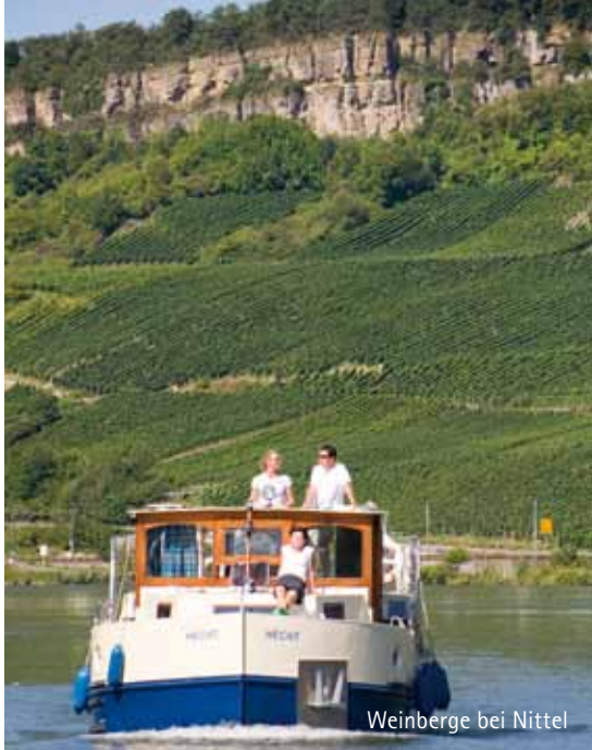
Weinberge bei Nittel