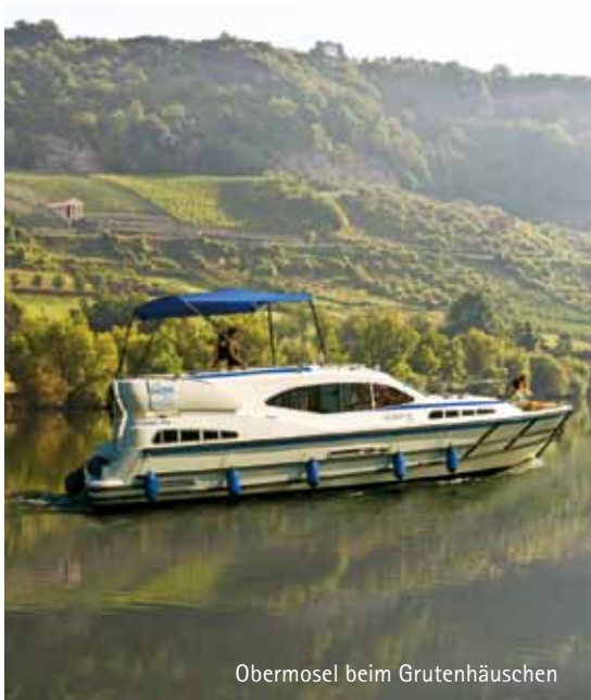
Obermosel beim Gutenhäuschen