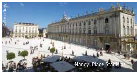
Nancy: Place Stanislas