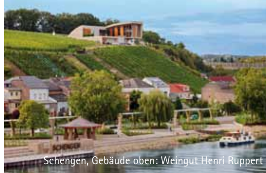
Schengen, Gebäude oben: Weingut Henri Ruppert