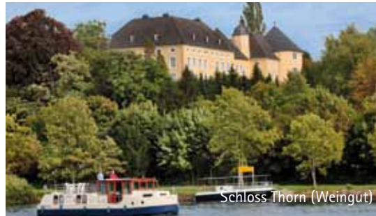
Schloss Thorn (Weingut)