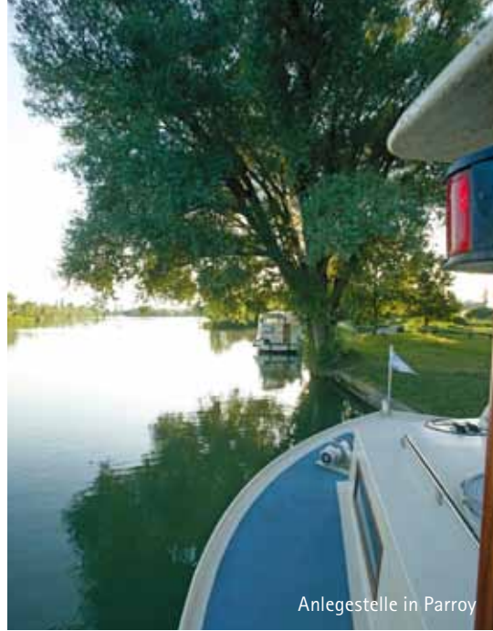
Anlegestelle in Parroy