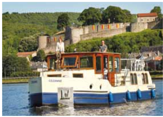
Von Sierck-les-Bains und Niderviller durch Frankreich, Luxemburg und Deutschland und an der Südlichen-Wein-Mosel: Boot & Wein 2012 zum Saisonstart in Niderviller.

Zwischen allen Basen in Deutschland und zwischen den Basen in Frankreich möglich!