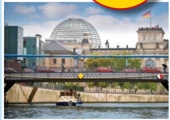
Die Basen Zeuthen und Marienwerder bieten sich für Törns in die ursprüngliche Natur aber auch ins pulsierende Leben Berlins an.