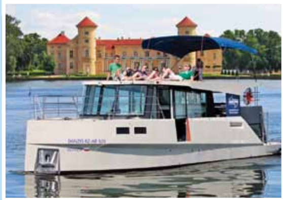
Ab Hafendorf Müritzt, Schwerin und Stralsund: Mecklenburg-Vorpommern und Brandenburg sind immer eine Reise wert.