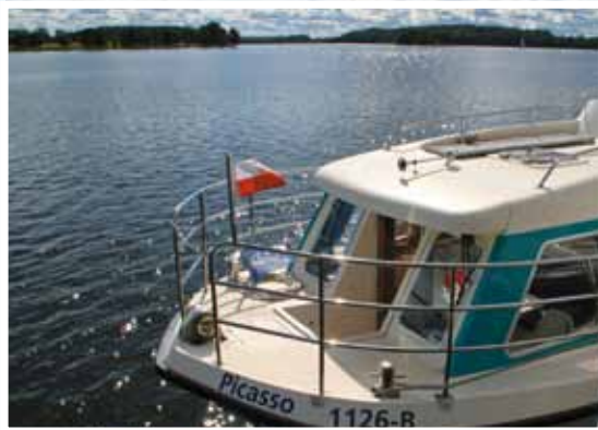
Jetzt können Sie die großen Masurischen Seen führerscheinfrei erkunden!